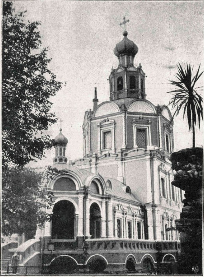
ДВОРЦОВАЯ ЦЕРКОВЬ ВЪ ПЕТРОВСКОМЪ-РАЗУМОВСКОМЪ.

Наши знания об убранстве интерьеров церкви неполны, но в любом случае в своем основном объеме это было светлое, высокое пространство, украшенное уходящим под своды восьмерика шестиярусным с колоннами иконостасом. В нижнем ярусе колонны были резные с виноградными кистями и листьями, а верхние - витые. В трех послед-