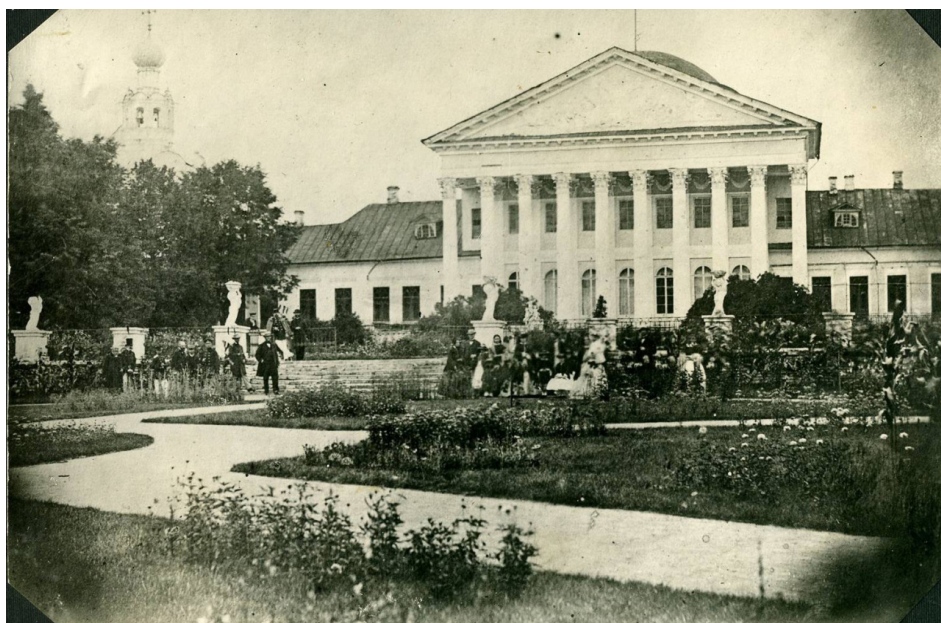
Старейшая фотография Петровско-Разумовского. Вид на главный дом усадьбы со стороны регулярной части парка

начальнику Посольского приказа Льву Кирилловичу Нарышкину. Сохранилось описание села 1704 г.: «В селе Петровском церковь каменная во имя